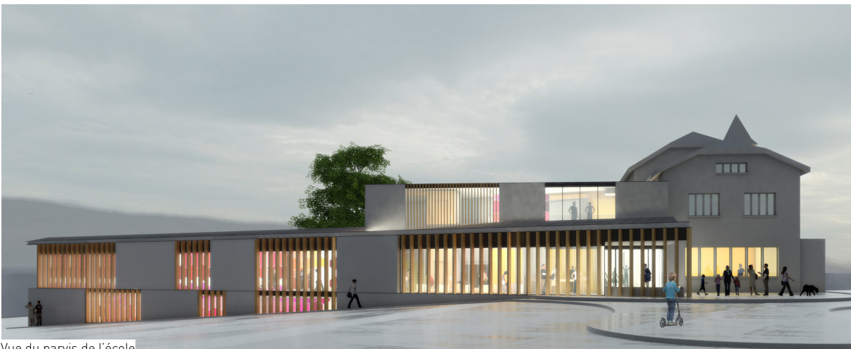
Vue du parvis de l'école